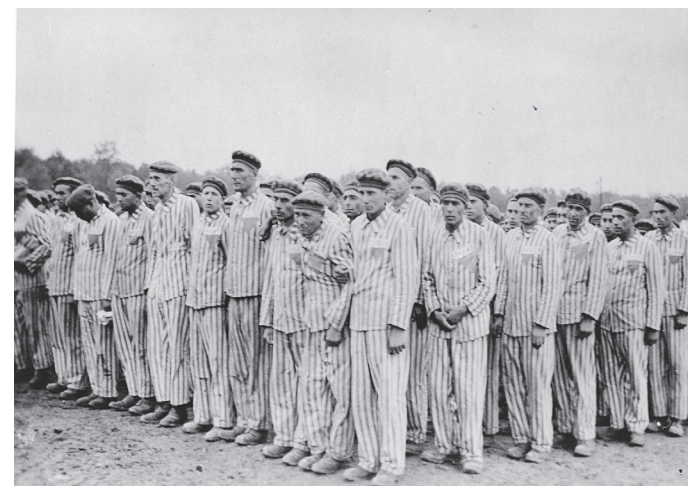
L'appel au camp de Mauthausen.