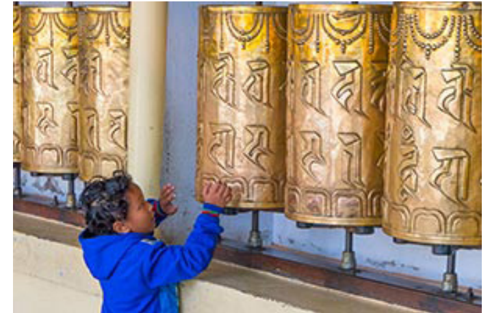
Moulin à prière bouddhiste

Les noms de la liste des juifs de Marchin sont alors symboliquement diffusés aux alentours, pour rappeler leur existence et l'histoire du site.