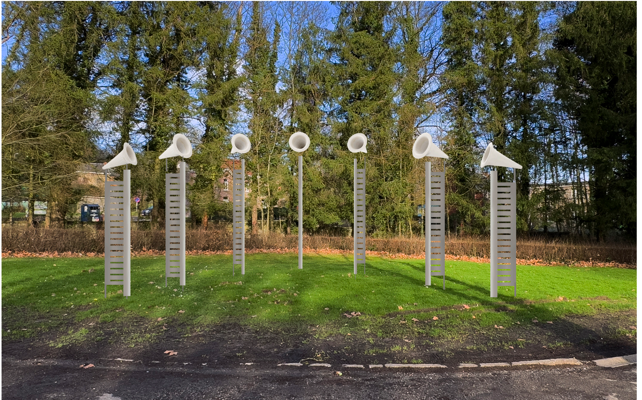
Simulation du projet proposé dans l'espace envisagé. Les coloris et matériaux présentés ici sont donnés à titre indicatif et pourront encore changer.