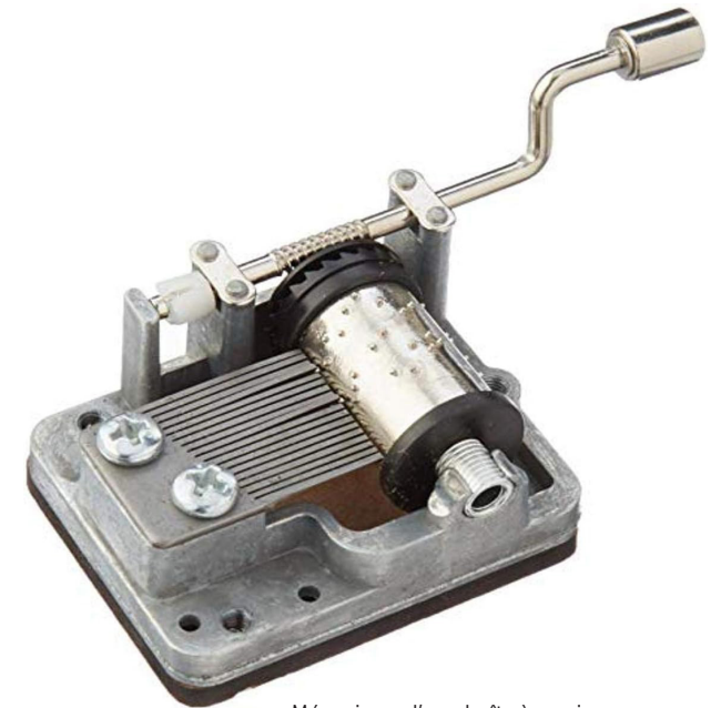
Mécanisme d'une boîte à musique

L'œuvre évoque ainsi le chaos de cette période où l'harmonie fait place au fracas de la guerre.