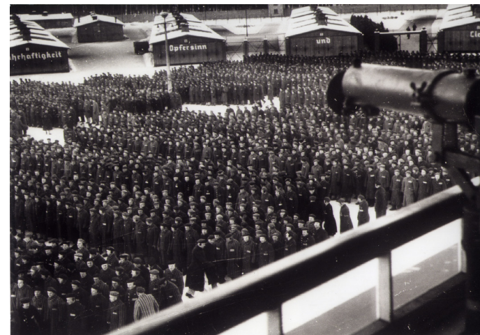
L'Appellplatz dans le camp d'Oranienburg-Sachsenhausen.